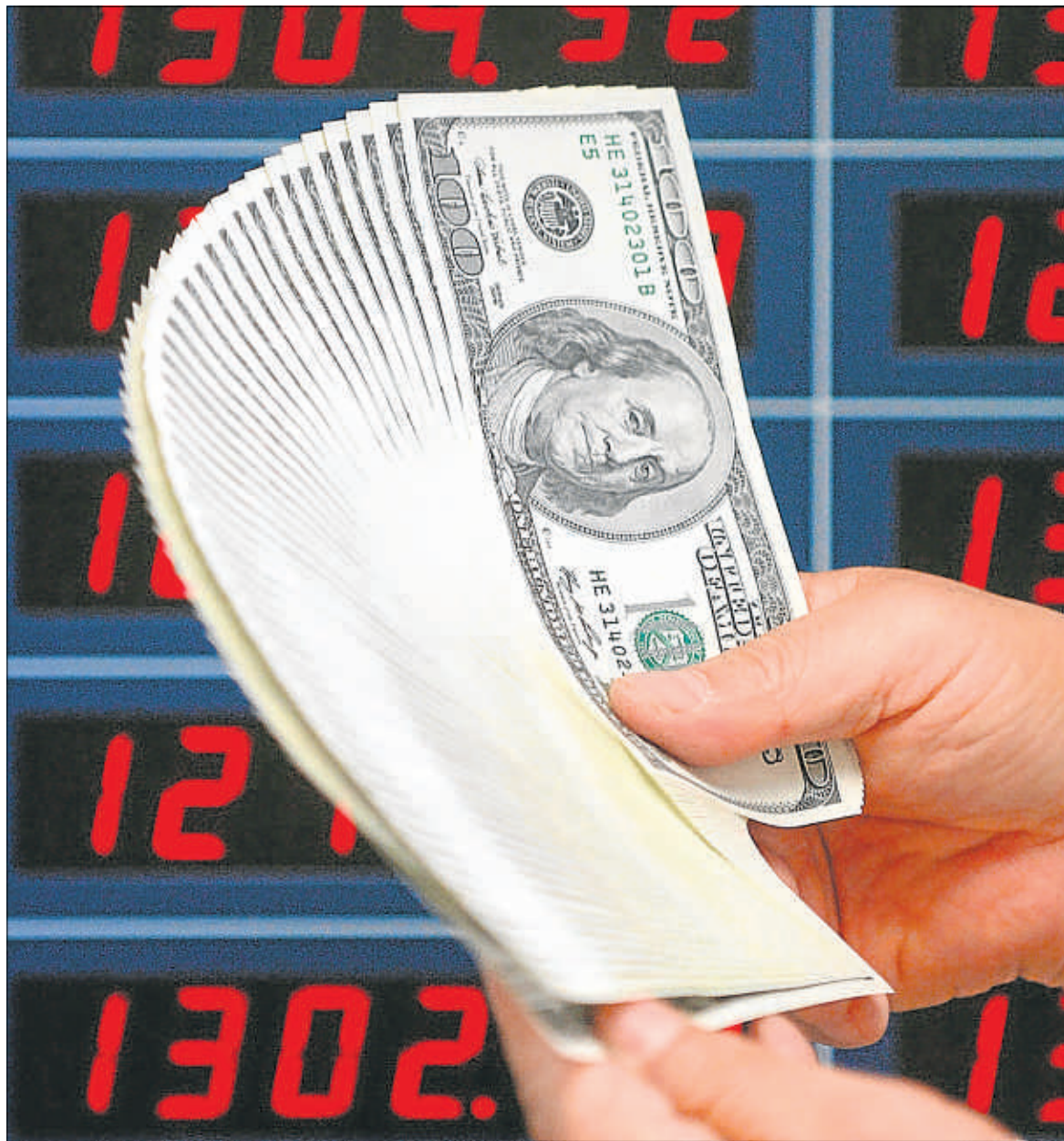
En el Forex se negocia un volumen diario de cinco billones de euros

“No tenemos nada que ver con un casino: nuestros clientes (son unos 500; la firma cobra una comisión de 0,35 euros por cada 10.000 euros invertidos) operan sobre los precios reales y directos que vienen del mercado interbancario. El negocio se convierte en un casino cuando es el propio agente quien determina el precio, un valor que a menudo no es real. En general, todos nuestros